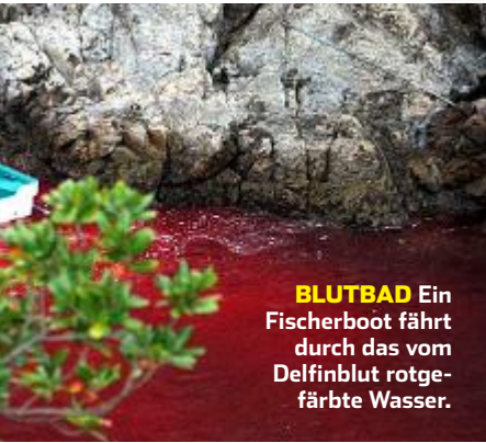
BLUTBAD Ein Fischerboot fährt durch das vom Delfinblut rotgefärbte Wasser.